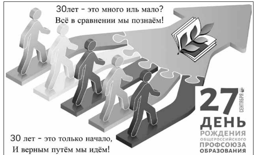
Профсоюзная организация детского сада № 172 Тюмени

На этой газетной странице - креативные открытки, фотографии полюбившейся акции «Нас объединяет книга» и даже тортики (какой день рождения без сластей?!) - малая часть подарков к юбилею. С праздником, друзья! И спасибо за поздравления!