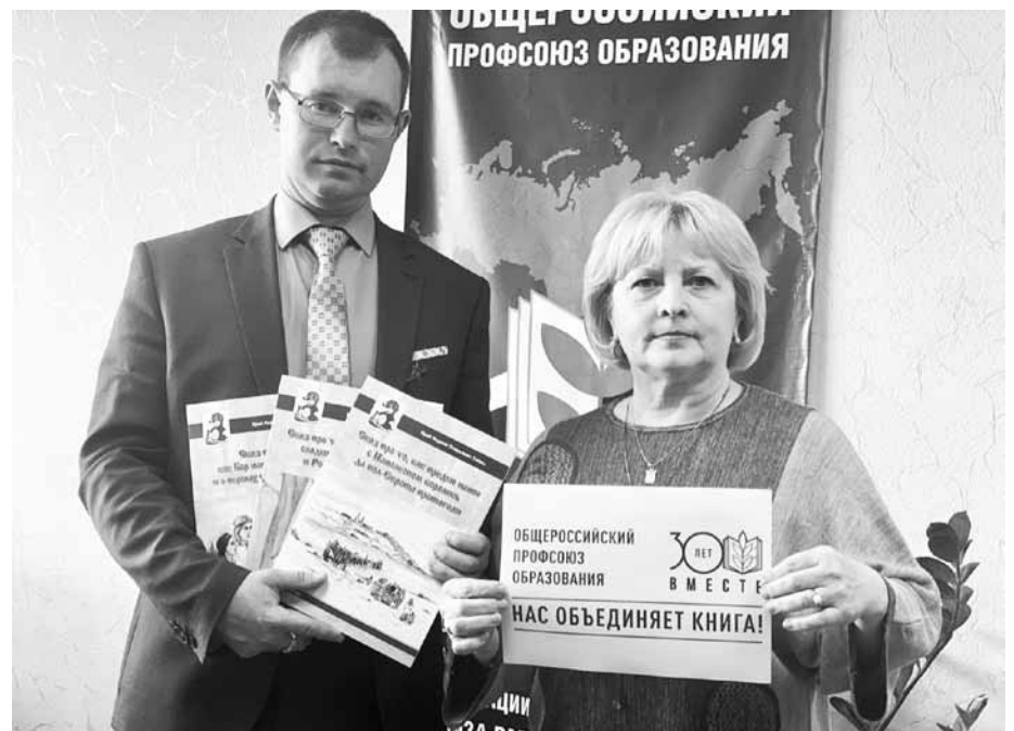
Борская районная организация профсоюза, Нижегородская область