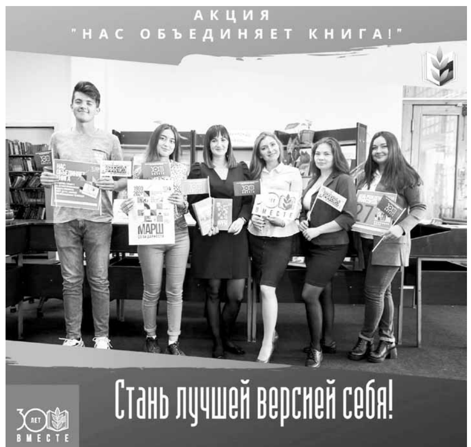
Ульяновский государственный технический университет

«МОЙ ПРОФСОЮЗ» (12+) номер выпуска 38 от 24 сентября 2020