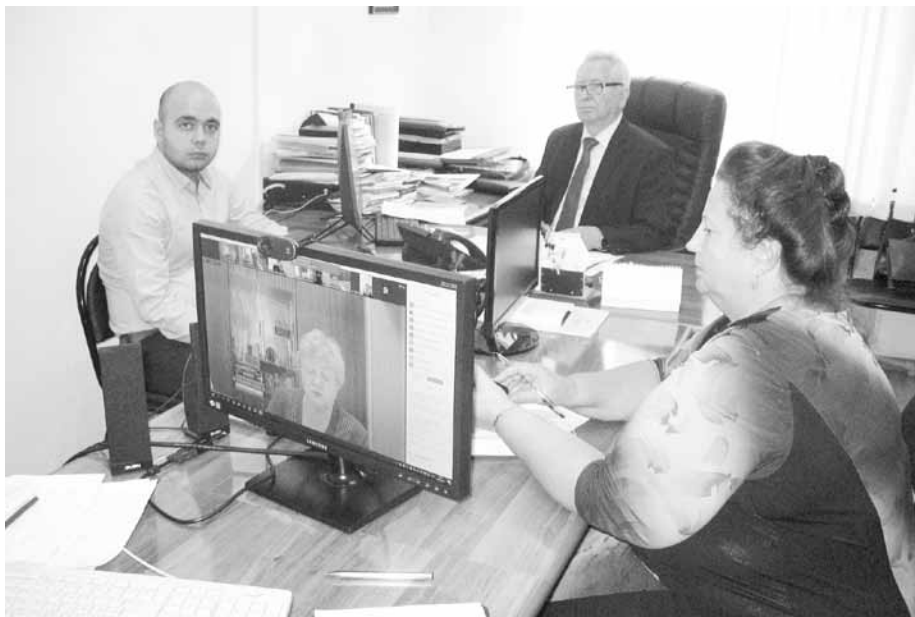
Заседание президиума прошло в режиме онлайн