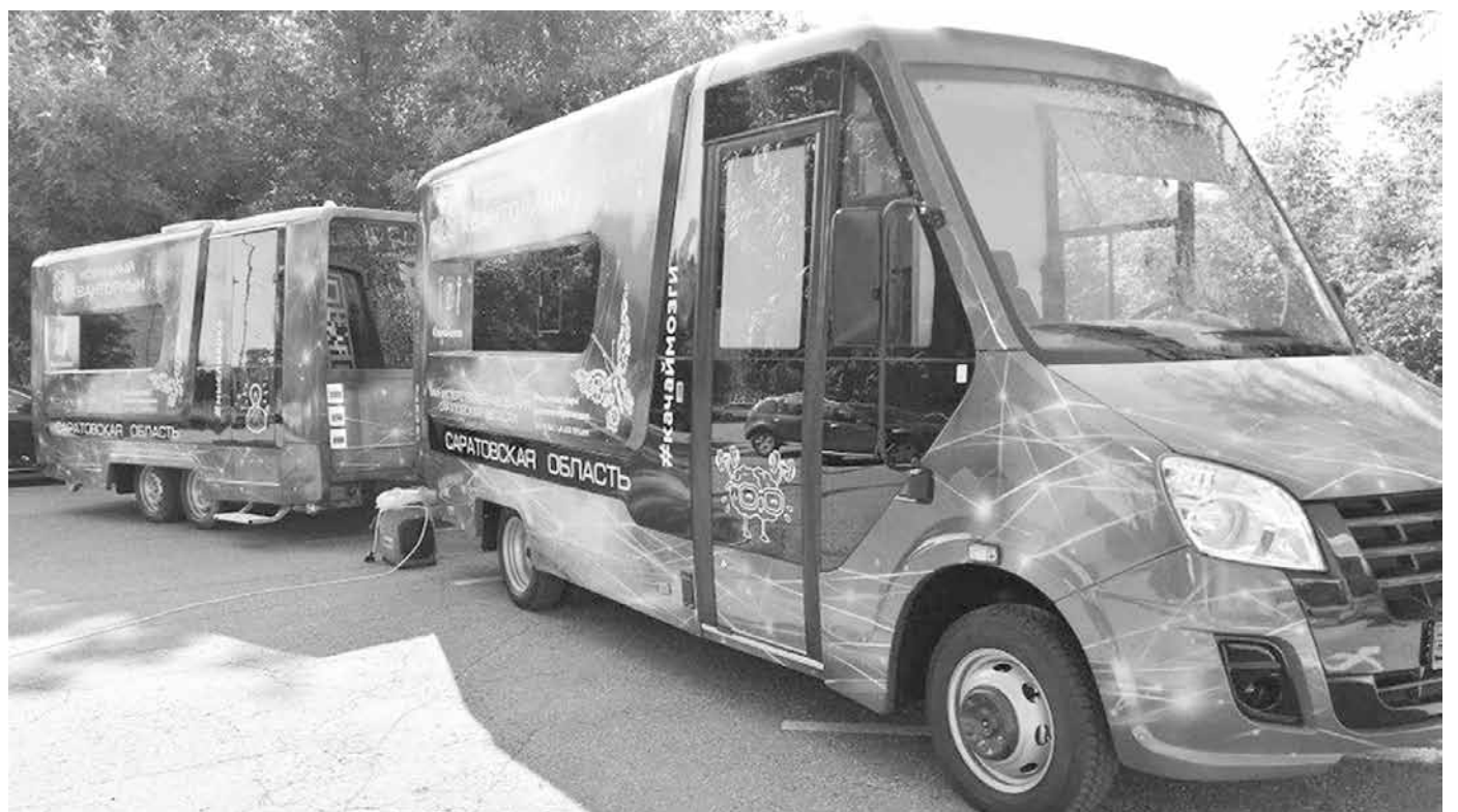
Мобильный технопарк «Кванториум»

Саратовцам не удалось перейти на окладную систему оплаты труда, поскольку денег в регионе на это не хватает, особенно сложно малокомплектным школам. Проф-