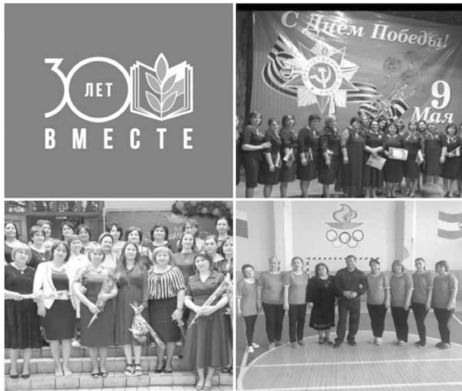
Школа села Арик, Терский район Кабардино-Балкарской Республики