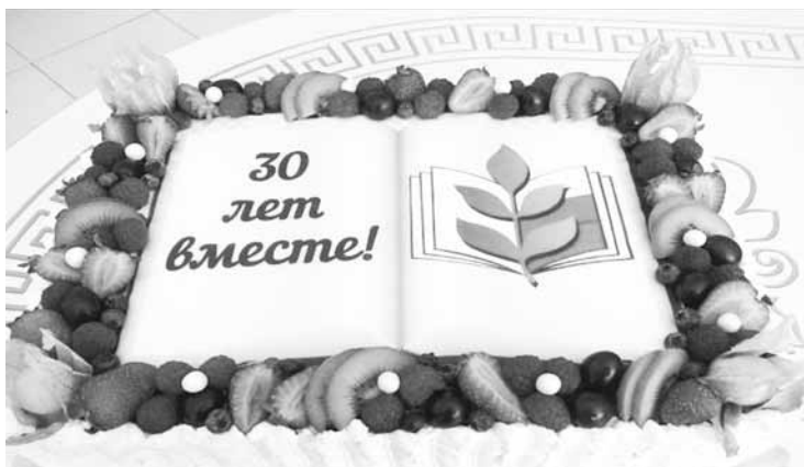
Новоспасская районная организация профсоюза, Ульяновская область